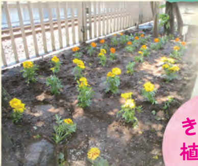
きれいに 植えられました