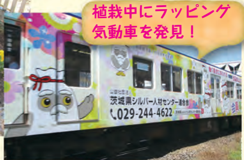
植栽中にラッピング 気動車を発見!