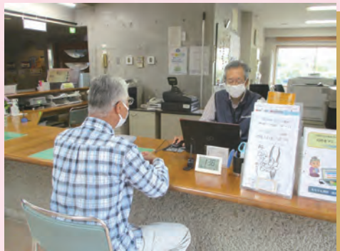
公民館での受付業務風景(2)