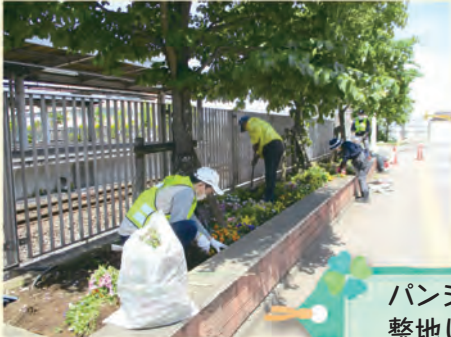
パンジーを撤去し、 整地します

守谷市公園等里親事業「花壇植栽ボランティア」としての活動は10年が経ちました。今年5月9日(火)、ボランティアメンバーの参加者11名が守谷駅東口に集まり、3ヶ所の花壇に日日草200株、マリーゴールド190株、コスモス36株の苗を植えました。