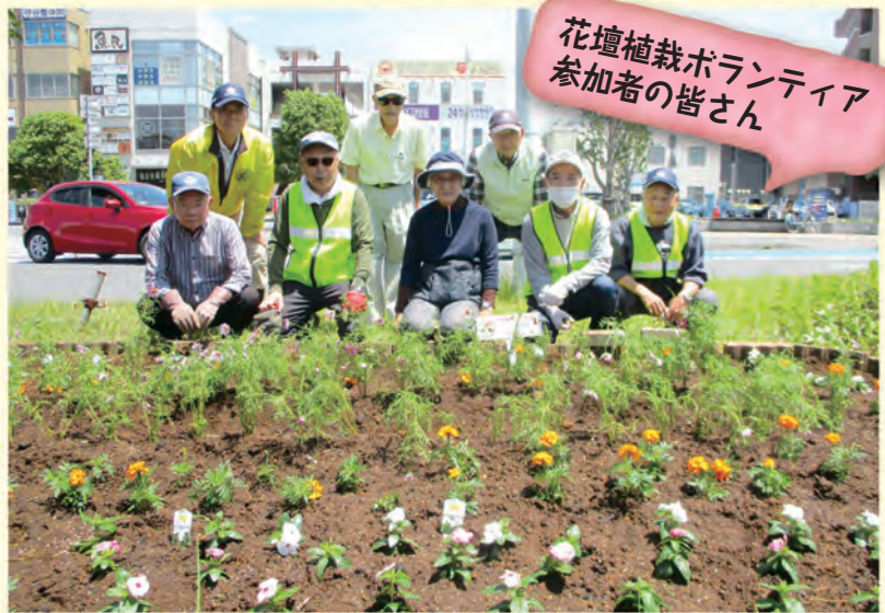
花壇植栽ボランティア 参加者の皆さん