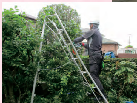
植栽（剪定）作業風景