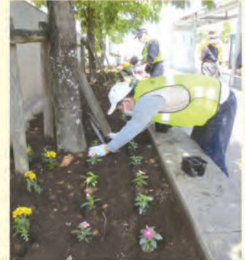
新しい苗を植えます