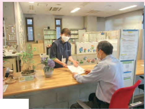
公民館での受付業務風景(1)