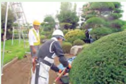
一般家庭の剪定作業

8月19日、今年度2回目の安全パトロールが実施されました。理事長をはじめ事務局および安全対策委員の5名で、今回は公共施設および一般家庭の剪定作業と草刈り作業の安全就業状況をパトロールしました。猛暑の中での作業ではありましたが、安全な服装、ヘルメット、安全帯の着用および三脚梯子の固定等が安全就業基準に沿って就業されていることが確認されました。また、現場にて改めて熱中症対策および蜂対策についての注意を喚起しました。