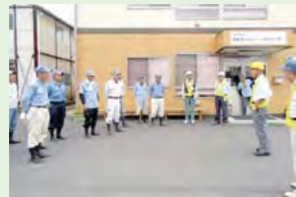
作業前のミーティング