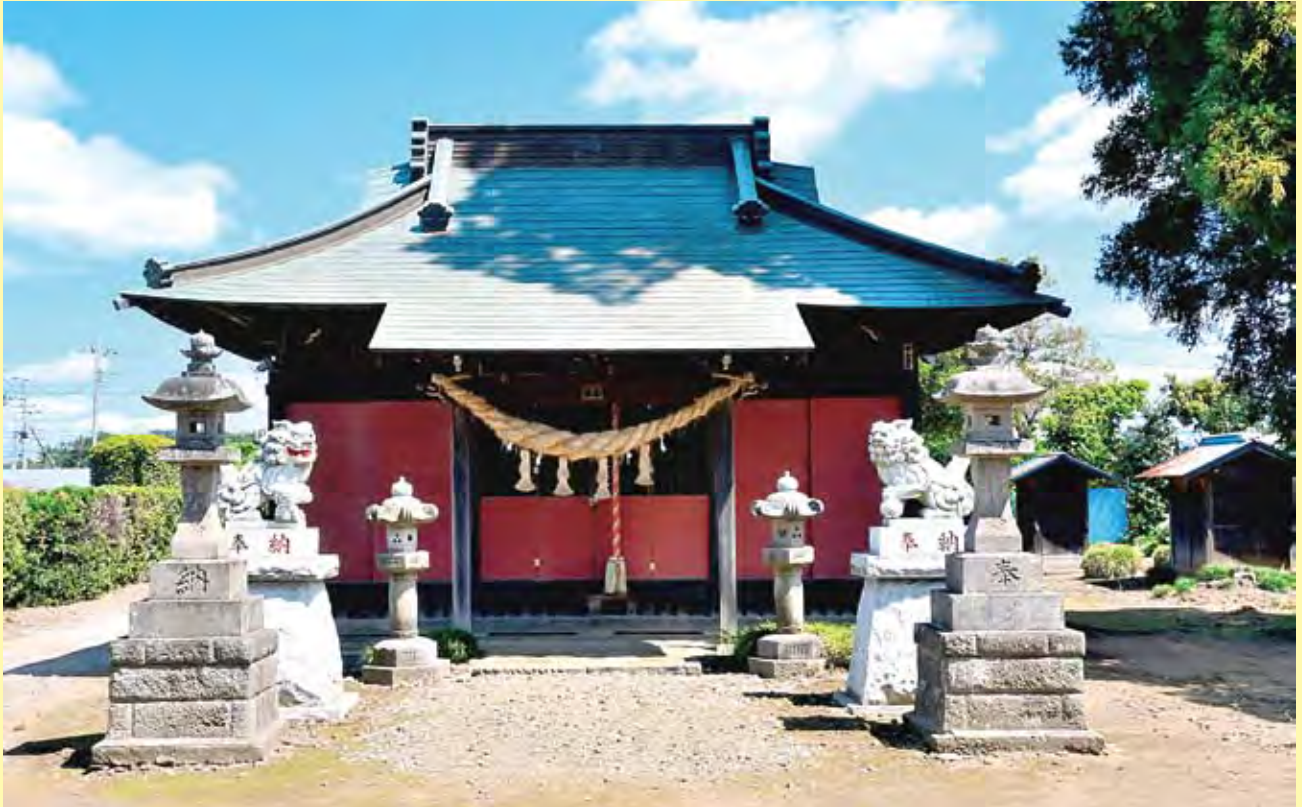
香取神社(立沢705番地)