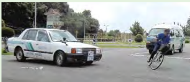
見通しの悪い交差点での自転車の進入