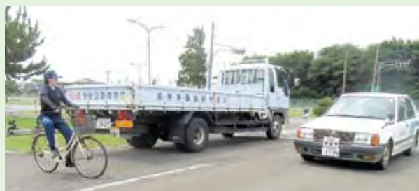
車両の陰からの飛出し自転車に注意！