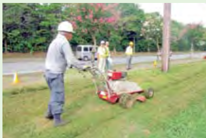
公共施設草刈作業